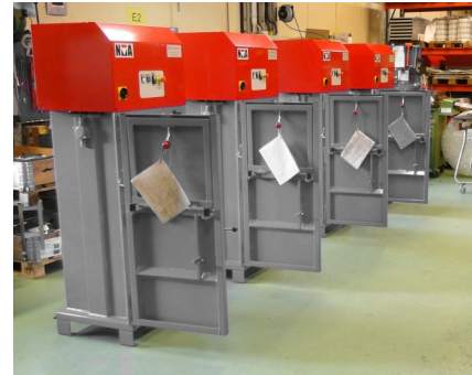
Tusindvis af Nättraby pressere er produceret siden 60'erne.